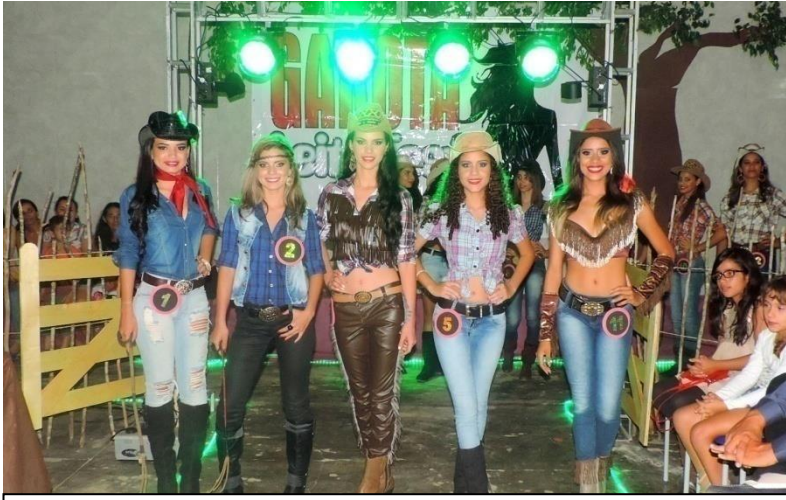
Concurso Garota Leite Fest 2015

Além dessas grandes festas, maioria concentradas no centro da