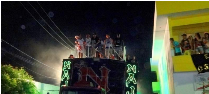
CECIFOLIA 2015: Foto Robson Lima.

A cultura do município de Santa Cecília é basicamente concentrada nas festas populares e tradicionais do calendário nacional: carnaval, festas juninas e natal. Além dessas, o já tradicional Leite Fest, entrou em 2015 na sua décima edição, tornando-se uma das maiores festas da cidade.