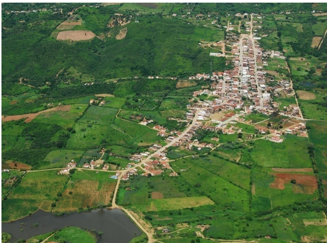
Foto aérea do centro da cidade de Santa Cecília: foto divulgação Prefeitura Municipal.

IBGE para 2014 é de 6.596 habitantes, um decréscimo que talvez aponte uma tendência para os próximos anos.